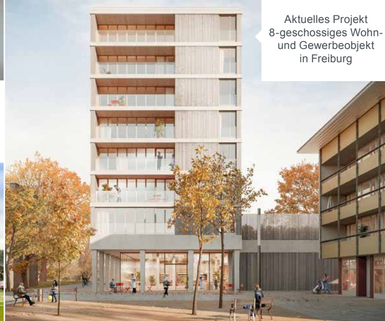
Aktuelles Projekt 8-geschossiges Wohn- und Gewerbeobjekt in Freiburg