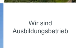
Wir sind Ausbildungsbetrieb