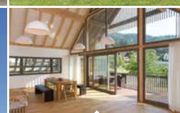
Umbau & Erweiterung