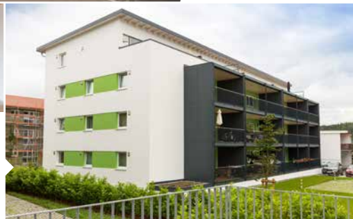
Mehrfamilienhaus mit 16 Wohneinheiten