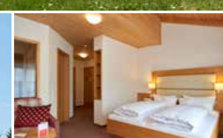
Hotel- & Gewerbebau