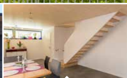
6 Reihenhäuser in Konstanz