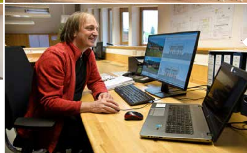
Wir sind Generalunternehmen