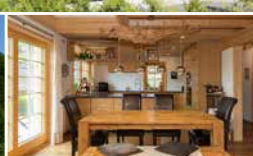
Mehrgenerationenhaus mit 3 Wohneinheiten