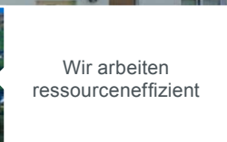
Wir arbeiten ressourceneffizient