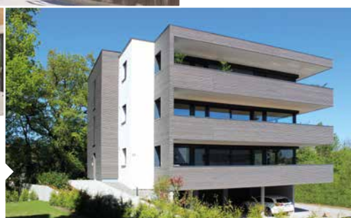
Mehrfamilienhaus mit 3 Wohneinheiten