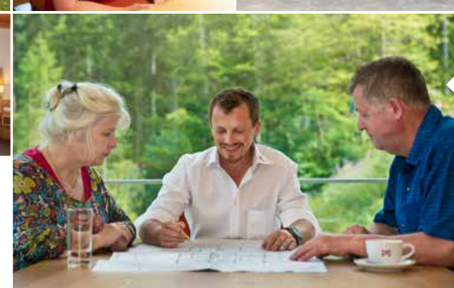
Wir haben Profis in allen Bereichen