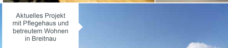
Aktuelles Projekt mit Pflegehaus und betreutem Wohnen in Breitnau